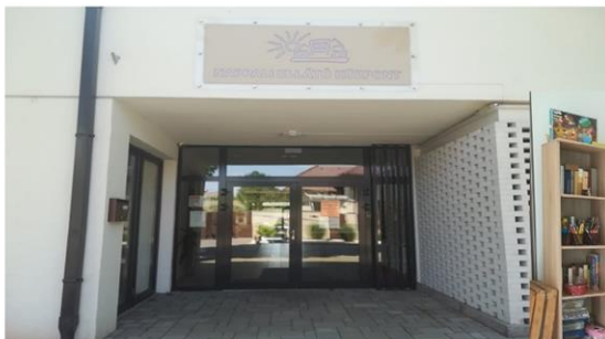
A Nappali Ellátó Központ az Őz utcán

A segítők jól ismerik az értelmileg akadályozottak segítségének módszereit, megfelelő ismeretekkel rendelkeznek az ellátottak egyéni képességei, személyiségvonásai tekintetében, így következetes elvárások mellett, egyénre szabottan nyújtanak segítséget az ellátottaknak.