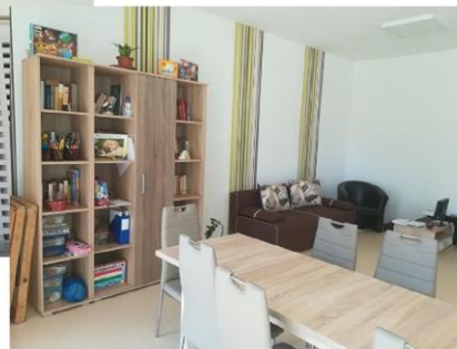
Foglalkoztató az Őz utcai telephelyünkön