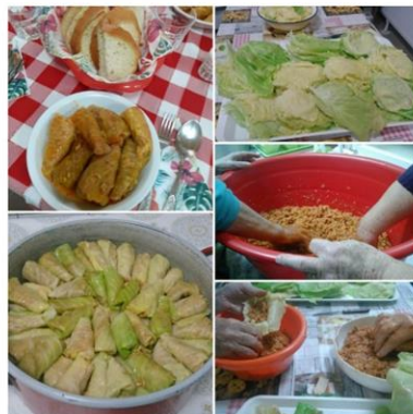
70. születésnap közös ünneplése és gasztronómiai hagyományápolás közös káposztatöltéssel az idősek nappali ellátásában