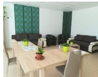
Foglalkoztató az Őz utcai telephelyünkön