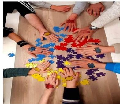
Foglalkozás az autizmus világnapján, a fogyatékosok nappali ellátásában